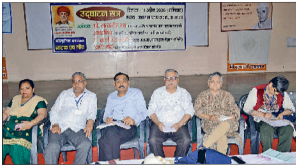
करनाल। ज्ञान विज्ञान समिति के सम्मेलन में सामाजिक मुद्दों पर मंथन करते हुए।

सेक्टर-8 स्थित महाराणा प्रताप सिंह भवन में चल रहे हरियाणा ज्ञान विज्ञान समिति के 11वें राज्य सम्मेलन के दूसरे दिन विभिन्न अहम विषयों पर व्यापक चर्चा की गई। कार्यक्रम की शुरुआत समूह चर्चा से हुई, जिसमें नई शिक्षा नीति, सामाजिक न्याय और वैश्विक स्तर पर युद्ध के प्रभाव जैसे मुद्दों पर विचार-विमर्श किया गया। विभिन्न जिलों से आए प्रतिनिधियों ने अपने सुझाव और सवाल मंच पर रखे, जिनका समाधान विशेषज्ञों द्वारा किया गया। सम्मेलन में वक्ताओं ने बताया कि पिछले 10 वर्षों में हरियाणा में करीब 5400 सरकारी