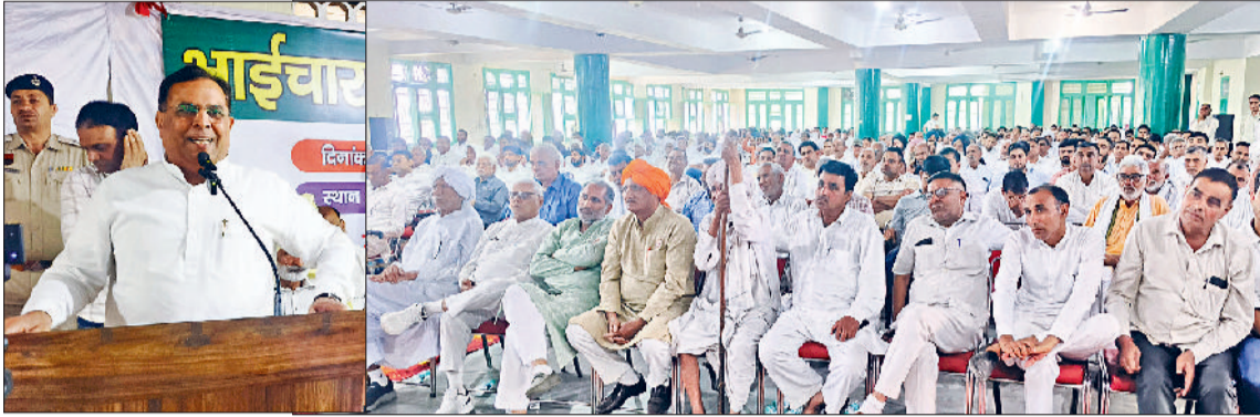
कुरुक्षेत्र। समारोह में मौजूद लोगों को संबोधित करते पूर्व वित्त मंत्री कैप्टन अभिमन्यु।