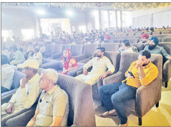
करनाल। एक कार्यक्रम में खाली पड़ी कुर्सियां।