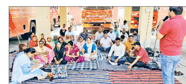
यमुनानगर। इंडस्ट्रियल एरिया स्थित दमकल कार्यालय पर मांगों को लेकर नारेबाजी करते फायर कर्मचारी।

फायर कर्मचारी ने रिवार को मांगों को लेकर शहर के इंडस्ट्रियल एरिया स्थित दमकल कार्यालय पर प्रदर्शन किया। फायर कर्मचारियों ने सरकार को चेतावनी देते हुए कहा कि यदि जल्दी कर्मचारियों की मांगों को पूरा नहीं किया गया तो भविष्य में लंबा आंदोलन चलाया जा सकता है। जिसके जिम्मेदारी सरकार की होगी। रिवार को फायर कर्मचारी भारी संख्या में इंडस्ट्रियल एरिया स्थित दमकल कार्यालय पर पहुंचे। जहां पर कर्मचारियों ने सरकार के