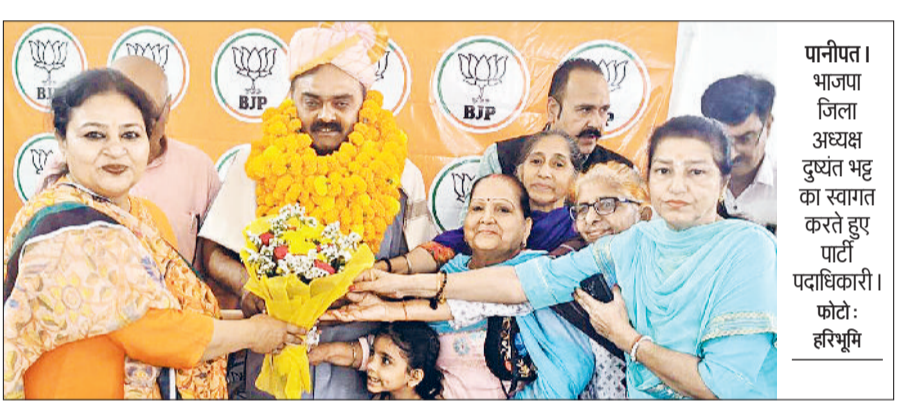
हरिभूमि न्यूज पानीपत

प्रधानमंत्री नरेंद्र मोदी के नेतृत्व व भाजपा के कार्यकर्ताओं की मेहनत के कारण भारत देश विकसित भारत बनने की ओर अग्रसर है। यह बात भाजपा जिला अध्यक्ष दुष्यंत भट्ट ने